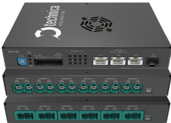
Capture Module 1000High

Das CM bietet durch den integrierten Webserver eine flexible und benutzerfreundliche Konfigurationsmöglichkeit. Der Zugriff auf die Gerätewebseite ist problemlos über einen Standard-Webbrowser möglich. Darüber hinaus sorgt die Möglichkeit zum Importieren/Exportieren einer Konfiguration für noch mehr Komfort.